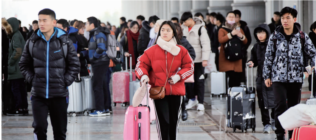
春运临近,车站旅客增多