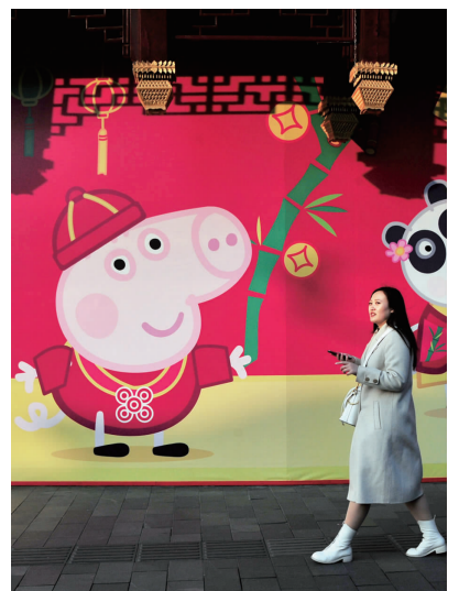
《小猪佩奇过大年》墙面宣传