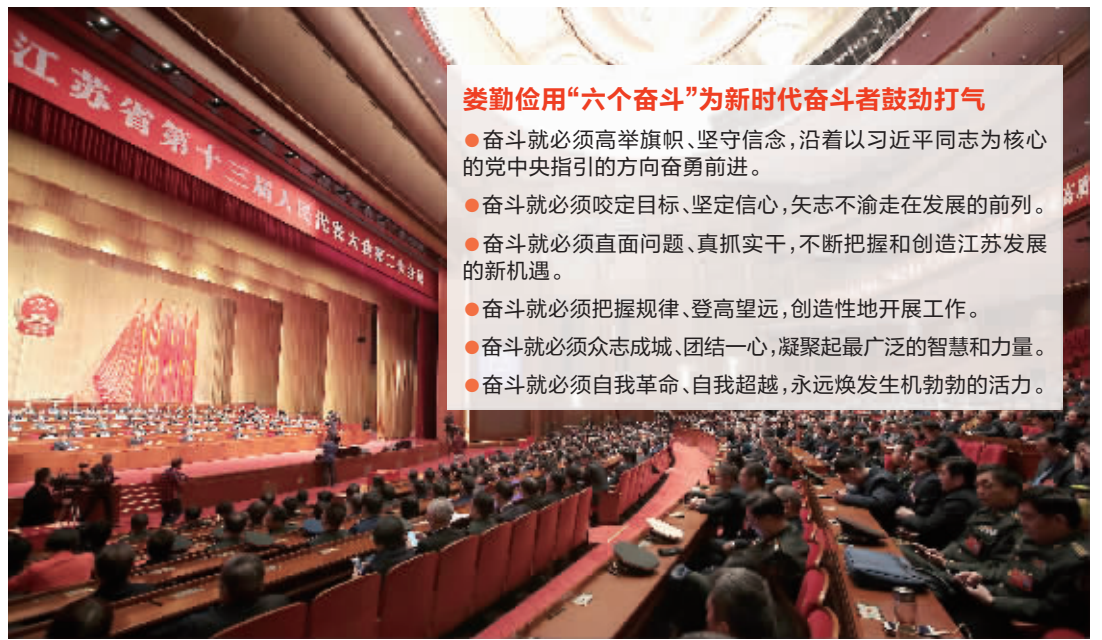
江苏省十三届人大二次会议胜利闭幕,圆满完成各项议程

娄勤俭说,奋斗就必须高举旗帜、坚守信念,沿着以习近平同志为核心的党中央指引的方向奋勇前进。要始终高举习近平新时代中国特色社会主义思想伟大旗帜,对标新思想不断解放思想、统一思想,结合江苏实际深入贯彻新思想、落实新思想;要树牢“四个意识”,坚定“四个自信”,践行“两个维护”,在习