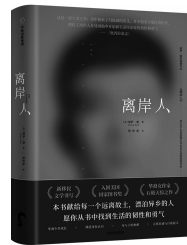
2018年12月 中信出版集团

年在雪国的时候,这一对小小的翅膀就足以让我服一辈子的苦役,成为终生的囚徒。”《翅鬼》是小说家双雪涛的处女作,曾获第一届华文世界电影小说奖首奖。在双雪涛构筑的极寒之域雪国,翅鬼是被囚深井、失去自由的奴隶,没有姓名,没有文字……整个故事充满了对历史的怀疑和对英雄的诘问:“强者为什么就要奴役弱者?”“权力对人的戕害到哪一天才能终止?”