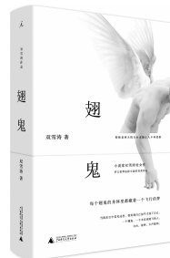
2019年1月 广西师范大学出版社

“你们的书上没提过翅鬼这个名字吧……雪国人绝大多数都是双手双足一个脑袋,谓之五体。雪国人描述崇拜常说五体投地,意思就是这五个地方全都着了地,就像我现在做的样子,其实就是磕头,可你们瞧见了,我除了这五体,还有两体怎么也着不了地,这就是我的翅膀。你们当然可以嘲笑我,不用偷偷地把嘴捂起来,我的翅膀确实又丑又小,和你们的翅膀比不了,可是当