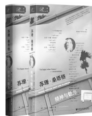
2018年12月 社会科学文献出版社·索·恩