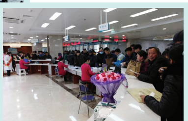
医疗环境越来越好,设备越来越先进,如今的淮安市第一人民医院正在朝智慧医院迈进