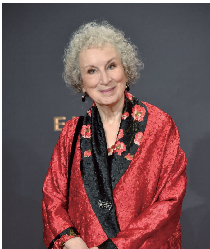
玛格丽特·阿特伍德