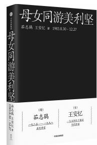
2019年1月 中信出版·大方 茹志鹃、王安忆 《母女同游美利坚》

整整一个时代,读者与编辑对他的期待都是标准的罗曼司。他想要“开掘一口新井,重寻一条水脉”,而不幸的是,只有极少数人欣赏他做的这番努力。这些故事所展现的,不是“一名忧伤的年轻人”虚添年岁、囿于自己刚刚创造的黄金时代,而是证明了他如何走在现代文学前沿,无论现代文学的发展有多错综复杂且富于实验性。