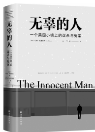
2018年11月 译林出版社 [美]约翰·格里森姆 《无辜的人》

Netflix根据本书制作的同名6集纪录片于2018年12月14日播出。罗恩·威廉森曾是前途无量的棒球明星,却被制造为杀人犯。罗恩1953年生于俄克拉荷马州埃达镇,当他因棒球事业受挫而不得不回家乡后,岁月对他露出了狰狞的面孔。1982年,一个年轻女孩遇害,在缺少证据的情况下,检察官和警方联手将他定罪,他在死囚区惊恐地等待着自己的命运,他被夺走了一切,仅存的是家人的支持以及无法证实的真相;他是无辜的。这个真实事件中极为沉痛的一点是,罗恩是一个严重的双向