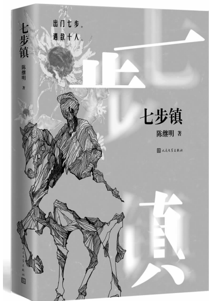
2018年12月 人民文学出版社 陈继明 《七步镇》