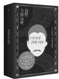
2019年1月 中信出版·大方 [美]F.斯科特·菲茨杰拉德 《我愿为你而死》

作者格里森姆花了一年半的时间,访问罗恩的家人、棒球教练、和他一起入狱的朋友,以及冤案涉及的法官、检察官和律师。作为有十年执业经验的律师,格里森姆试图揭示出一幅误判的图景,在美国,每个州每个月都在发生误判,原因大同小异:侦查工作不当、垃圾科学、说谎的目击证人、不负责任的辩护律师、傲慢的检察官。