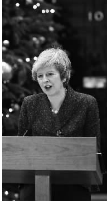
12日,英国首相特蕾莎·梅在唐宁街10号外召开记者会,称将竭尽全力挺过不信任投票