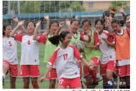
广丰中学女足姑娘们

女子足球队成立以来,学校实施“精细管理”,由校长亲自挂帅成立女足日常管理领导小组,建构专人负责、多部门协作的工作机制。同时,以女足为“点”,学校以点带面,推进校园足球的深入开展,带动校园足球全“面”开花。