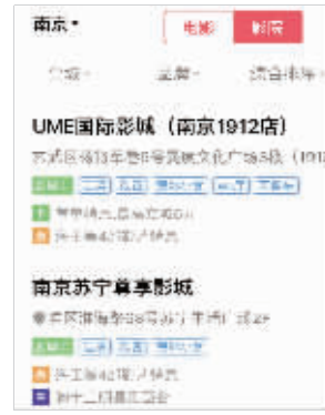
淘票票上有退票、改签等标签