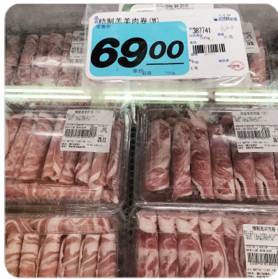
南京市场的羊排、羊肉卷都比去年贵了