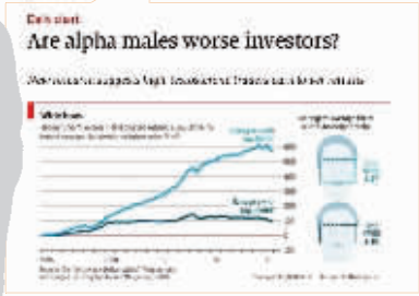
《经济人》刊登的论文，关于基金经理面部宽高比对业绩的影响