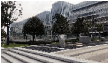
广场上绿化设施可吸收雨水