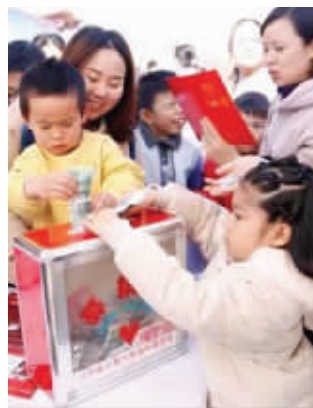
小朋友参加义卖捐赠 通讯员供图

“乐善今生爱在牛首”爱心义卖暨江苏音乐台“音乐种子春蕾助学行动”捐赠活动由南京牛首山文化旅游区主办,江苏音乐台、南京牛首山公益慈善基金会、江苏省儿童少年福利基金会共同协办。活动邀请了江苏音乐台明星DJ作为嘉宾主持,现场举办爱心义卖、文艺演出、趣味互动等创意活动,并在腾讯公益及牛首山微信平台开通线上捐赠渠道,呼吁广大市民助力“音乐种子春蕾助学行动”项目,受到了在场参与家庭与爱心人士的一致好评。活动当天义卖所得由牛首山公益慈善基金会接收,并向江苏省儿童少年福利基金会捐助20位贫困学生全年生活费用,江苏儿童少年福利基金会现场为牛首山授予“爱心慈善单位”荣誉称号。