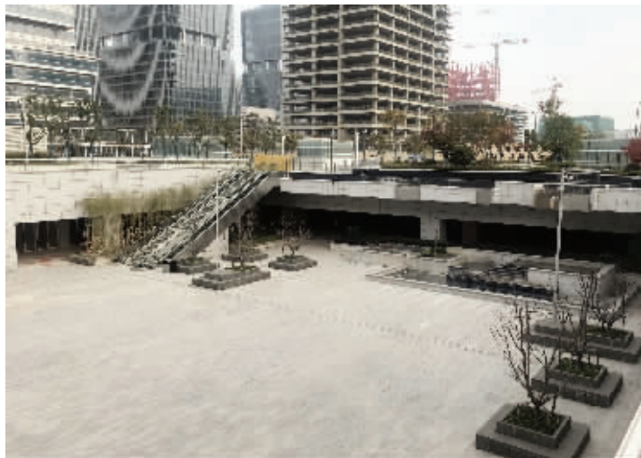
乘客可从广场的扶梯进入地下空间