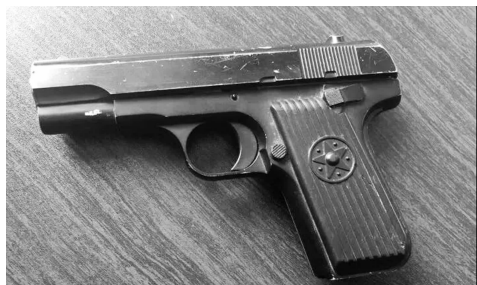
男子所持的玩具枪

快报讯(通讯员 张斌 孙晓雄 记者 林清智) 日前,在镇丹高速丹阳北收费站出现了惊心动魄的一幕:一名男子竟然掏出“手枪”威胁收费站工作人员,并将“手枪”顶着对方的头部。接到报警后,丹阳市公安局大泊派出所民警通过调取监控锁定了这名男子,并于几天后将该男子抓获。