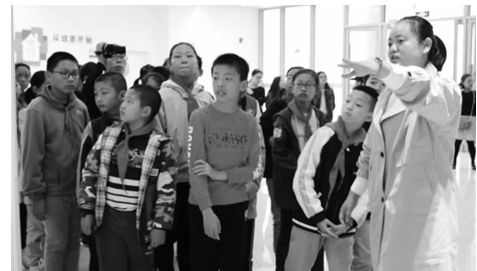
了解天爱星娃们的衣食起居及学习情况

10月31日下午,常州市西林实验学校六年级学生志愿者代表在老师的带领下,走进常州天爱儿童康复中心,与天使儿童近距离接触。西小桂花娃们在天爱康复中心陶主任的带领下,走进这座充满爱的小天地,参观了解天爱星娃们的衣食起居及学习活动等。果蔬房外,看着天使儿童艰难地灌溉,桂花娃们为命运的不公而伤感;音乐室内,桂花娃与天使儿童共同击打非洲鼓,让乐声传递友爱……参观活动结束后,西小的孩子纷纷表示,感恩眼下所拥有的,更应伸出援手帮助需要帮助的人。