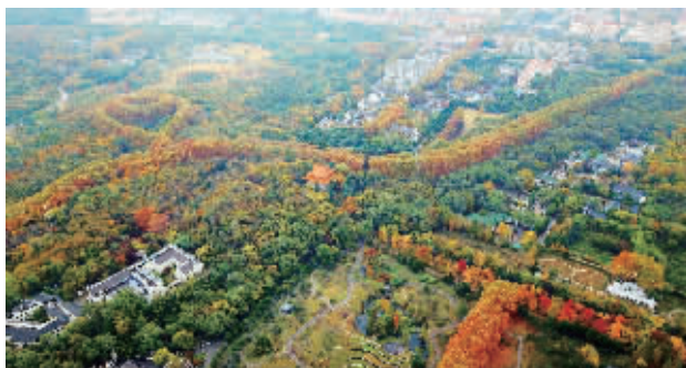
最美“项链”,来中山陵邂逅缤纷秋色

在天气条件较好的情况下,园林、环卫部门将日常的清扫工作转变为“捡拾保洁”,保持环境的整洁卫生。而活动期间如遇雨雪大风天气,园林、环卫部门将及时进行落叶清扫,切实保证城市环境整洁和市民出行方便。