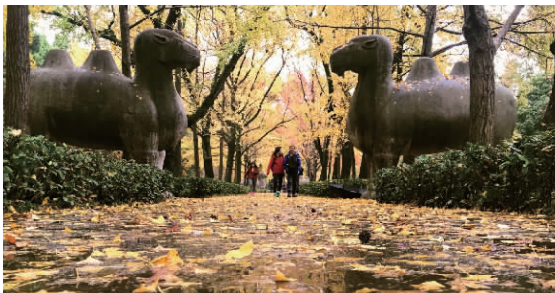
明孝陵石象路五彩斑斓,落叶缤纷,进入最佳观赏期