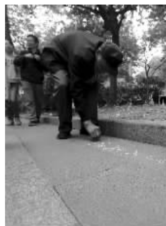
老人在地上写字表谢意