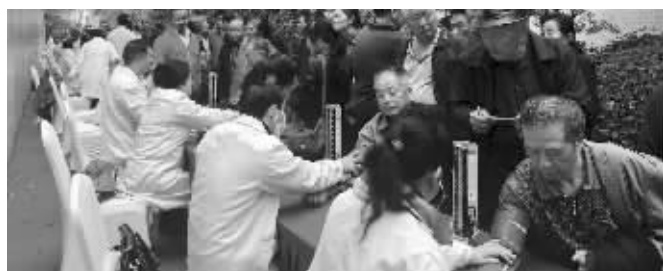
义诊现场