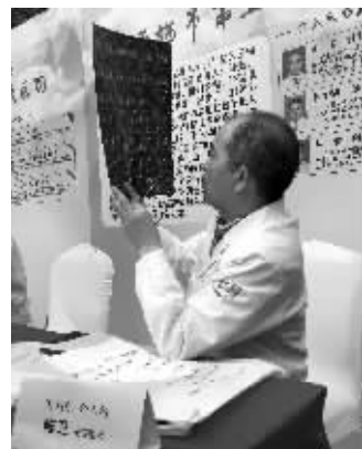
医生为患者看报告