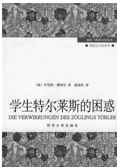
《学生特尔莱斯的困惑》