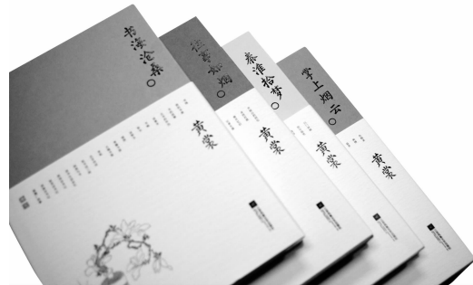
2018年8月 江苏凤凰文艺出版社 《黄裳作品精选》

黄裳先生是当代中国公认的藏书大家、版本学家,同时也是散文大家,其独树一帜的文化散文堪称当代文坛一绝。先生秉承了“五四”一辈学人独立不羁的风骨,以博古通今的学养和中国传统文人雅士独具的那份情调与趣味,为汉语散文注入了独特的魅力。“黄裳作品精选”系列由江苏凤凰文艺出版社出版,共分为《秦淮拾梦》《书海沧桑》《往事如烟》《掌上烟云》四部。