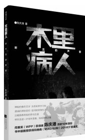
2018年7月 江苏凤凰文艺出版社 《木里病人》 陈庆

《往事如烟》记叙了黄裳与数十位文化名家的交游往来,在素淡淡墨中透视背后的时代变迁,还原老辈文人的至情至性。书中介绍了傅斯年、许广平、周作人、许寿裳、钱锺书、杨绛、郭沫若、茅盾、冰心、何其芳、朱自清、废名、闻一多、冯友兰、沈从文等现代名家。