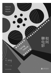
2018年10月 未读·北京联合出版公司 《如何聊电影》 [美]安·霍纳迪 著

2014年3月28日,马格南基金会宣布了2014应急基金的获得者,中国摄影师陈庆获此殊荣。该基金旨在帮助独立摄影记者调查完成未被报道但应被揭示的故事,使它们得到应有的重视。