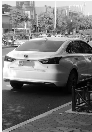
路边的网约车

记者在现场看到,就礼让斑马线而言,还是公交车以及出租车做得相对较好,而网约车礼让的则相对较少。还有很多车看起来是私家车,其实也是网约车,一般排在第一辆的车进行了礼让,后面也跟着礼让,如果第一辆车不让,后面的车就会随着前行。