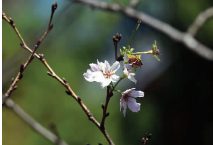
最近,鸡鸣寺路上,两棵樱花树傻乎乎地开着花