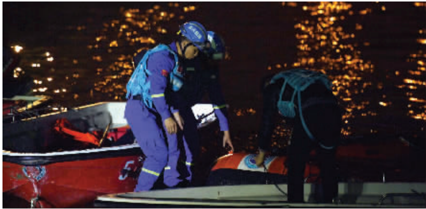
夜幕降临后,搜救工作仍在继续

10月28日上午10时08分,重庆市万州区长江二桥上的一辆公交客车在行驶中突然穿过中心实线,撞上对向正常行驶的小轿车后,越过路沿,撞断护栏坠入江中。警方初步确认当时公交客车上共有驾乘人员10余人。现场搜救人员基本判断公交车位于水下约68米处。截至20时,救援人员已打捞出2具遇难者遗体。夜间救援工作仍在持续进行中。