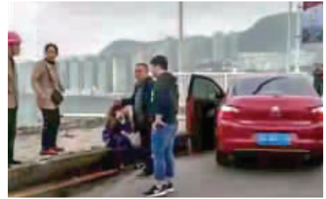
事故发生后,桥上群众惊魂未定