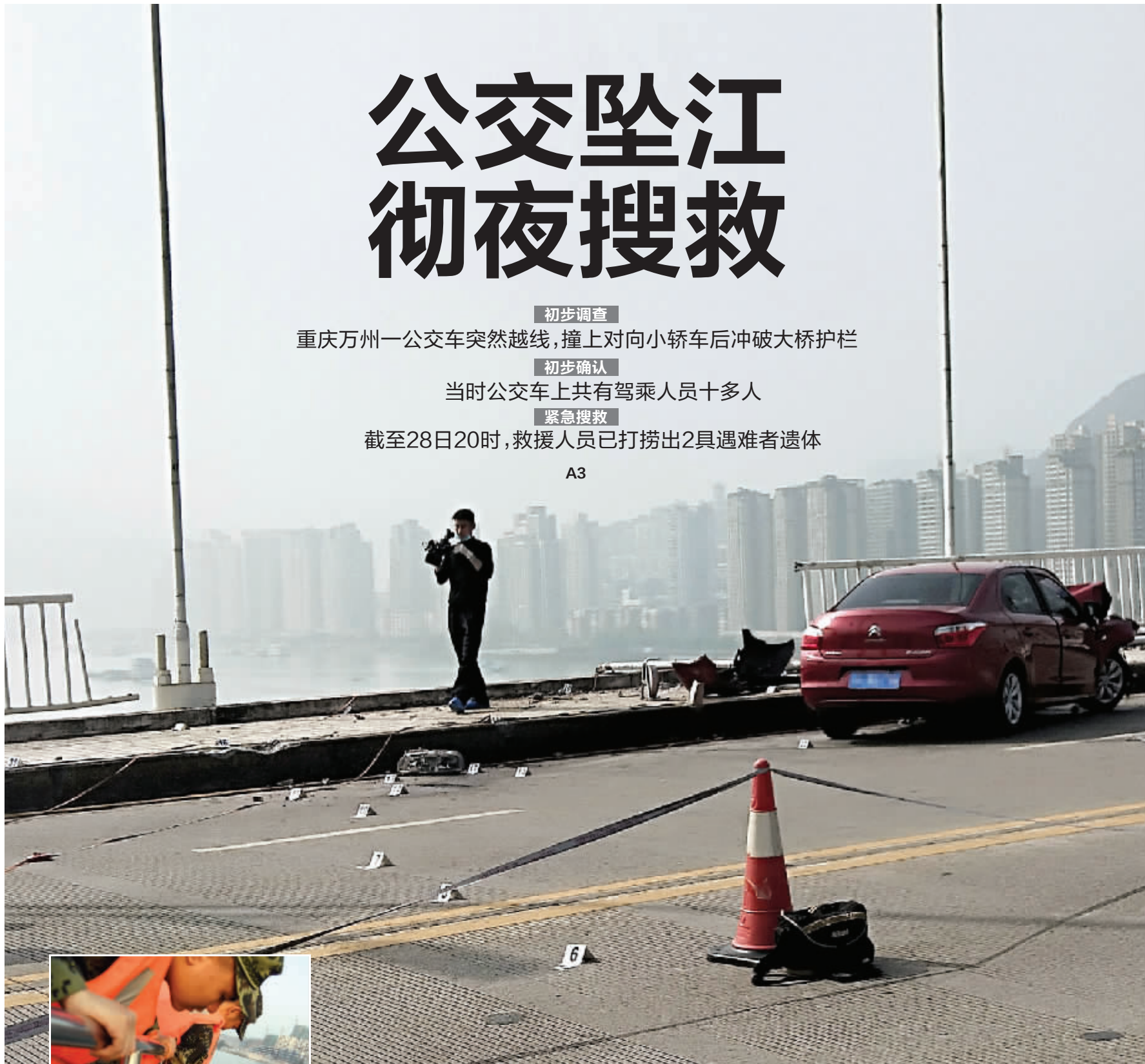
事故现场