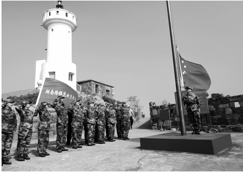
岛上举行了庄严的升国旗仪式

10月26日,南京鼓楼区湖南路模范女子民兵连的13名民兵代表,从南京赶到连云港灌云,登上开山岛,近距离感受全国“时代楷模”王继才烈士生前和妻子王仕花守岛的艰辛,接受一次深刻的爱国主义教育。现代快报记者了解到,在岛上,女民兵们认真聆听王仕花回忆她和丈夫王继才的守岛故事,听着听着,女民兵们就忍不住流下眼泪,大家都十分感佩这对孤岛夫妻为了祖国国防事业32年来付出的巨大牺牲以及无私奉献的精神。当天,湖南路模范女子民兵连还聘请王仕花担任该连的“名誉指导员”。