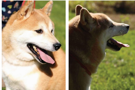
帅气无死角,不拍个天价你们好意思吗?

2017年8月,苏州市姑苏区人民法院通过淘宝司法拍卖平台对近400只梅花鹿整体拍卖。这些梅花鹿来自当地一个养鹿场,养鹿场租用的土地到期后,鹿场主迟迟没有搬离,最终拖到法院强制执行,被依法拍卖。这批梅花鹿在两次流拍后,进入变卖程序,最终被苏州动物园买下。