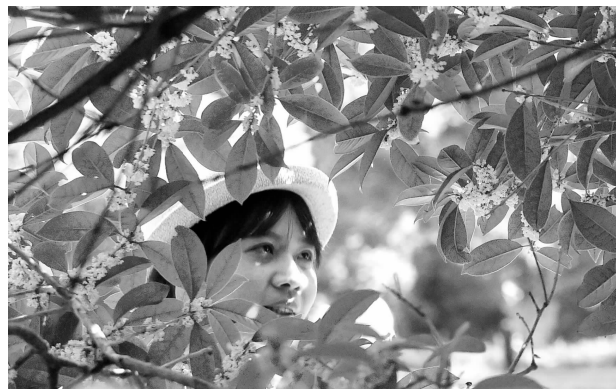
桂花飘香,吸引了不少游客拍照留影