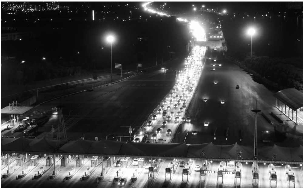
今天凌晨1点多,南京长江二桥收费站,等待过江的车排成长龙