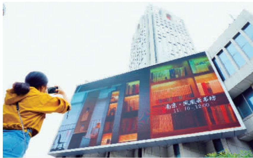
昨天,现代快报鼓楼广场大屏对本次活动进行了同步直播