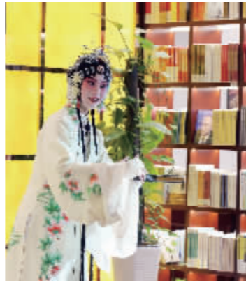
吾在书舍的昆剧表演

正如《红楼梦》与南京的关系非同一般一样,千百年来,南京吸引着历代的文化墨客,文学一直滋养着这座古都。中国历史上第一部文学理论专著《文心雕龙》作者刘勰,是在南京写出这部著作的;吴敬梓先生在《儒林外史》中用“菜佣酒保都有六朝烟水气”来形容南京,这也成了南京的一种城市性格。