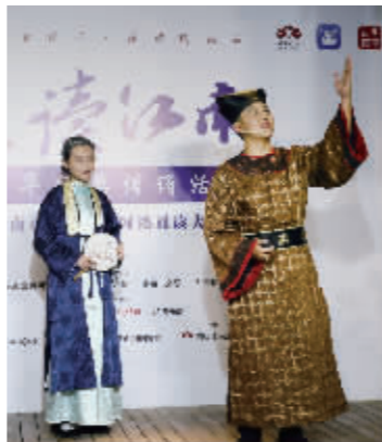
台城书房的古装诵读