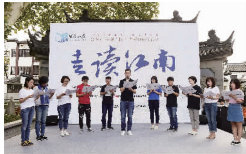
江南贡院举行的中华经典传诵活动

“常州的文化名人多不胜数,赵元任、周有光都是著名的大家,常州的青果巷,过去云集了一大批文艺大家。清代的六大画家就有三个长期在常州生活,当时由常州形成的没骨画法到现在还有非常深远的影响。”葛金华介绍,才人辈出的常州,不但对全国乃至世界的文化艺术发展产生较为深远的影响,这座城市所形成的独特文化氛围还影响着后来的文化人,指引他们在文艺创新中承担起不同时代的社会责任和使命。