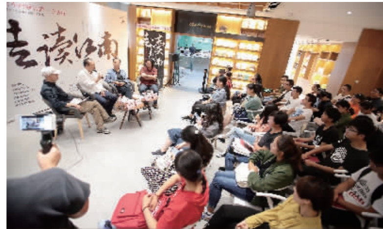
凤凰云书坊,嘉宾与观众交流