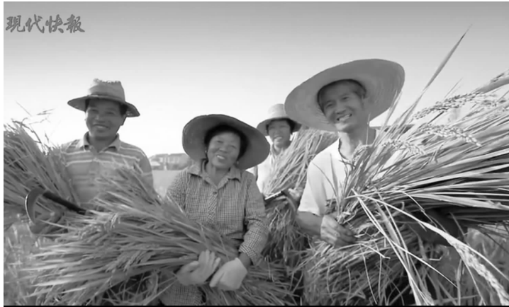
又是一年丰收时 H5截图