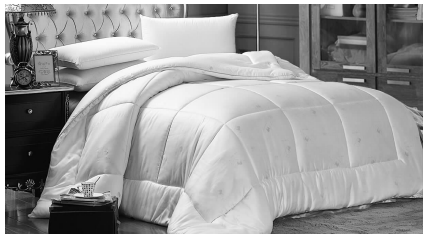
规格:白、粉可选,200 x 230cm

此次定制被子的填充料采用1.33赛丝棉和7D羽丝棉,黄金配比,就是为了达到蓬松、保暖、透气的效果,被子统一规格为200 x 230cm,颜色分为粉色和白色两款,您可以根据自己的喜好选择被子的颜色。本次推出的羽丝绒春秋被,采用厂家订单式采购,直接生产,去掉所有中间环节,把实惠留给广大顾客。