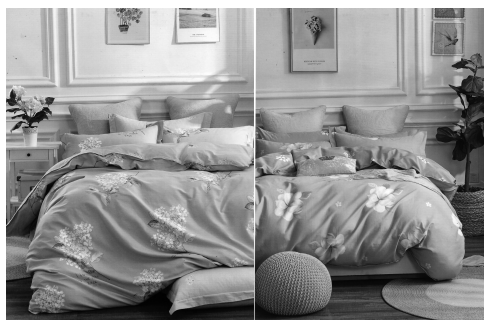
规格:被套200cm x 230cm 床单240cm x 250cm 枕套48cm x 74cm x 2

立秋之后,天气转凉,是到了撤掉床上铺了一夏天凉席的时候。其实,床上用品特别是床单、被套也需要“更新换代”,那就来快报特供优品看看吧。对于南京人来说,大同家纺(原南京大同被单厂)绝对是个充满感情与记忆的老字号品牌。为了回馈南京人对该品牌的热爱和支持,快报特供优品携手大同家纺,为读者们再次带来质量好、价格实惠的优质全棉床上四件套。