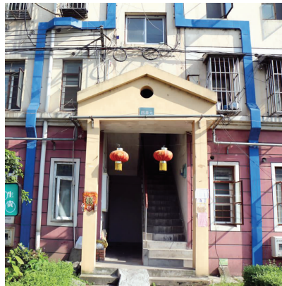
整治前的单元门口