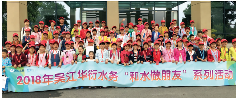
小记者合影