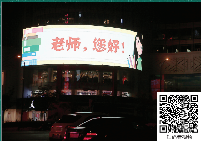
新街口大屏为教师亮灯