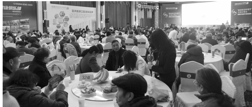
往届康贝佳答谢盛典现场座无虚席

康贝佳作为知名连锁口腔品牌,自创建起便将“严谨治医、以人为本”作为立院宗旨,广纳国内外优秀口腔医学人才,不仅有省口、市口专家长期坐诊,还有来自韩国、意大利、德国的专家在全国连锁各分院定期巡诊。本月14日康贝佳将迎来9周年感恩答谢盛典,报名参加可现场见证南京电视台《有请当事人》栏目主持人方方在康贝佳种牙的全过程,与韩国WISE齿科院长任势雄博士领衔的中外专家团面对面沟通,想参加的市民可拨打86980851报名并到院领取入场券。