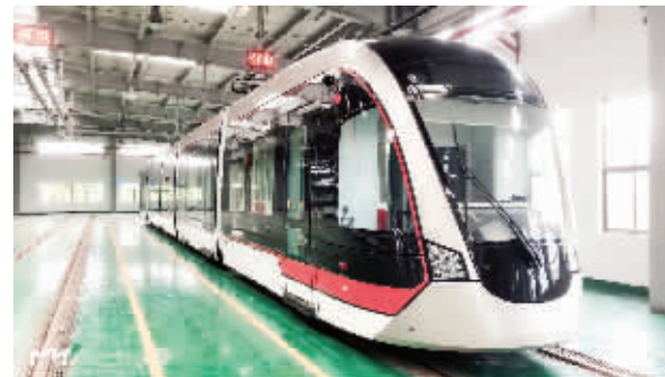
麒麟有轨电车