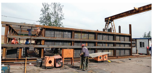
龙山制焦有限公司脱硫设施安装施工

快报讯(通讯员 苏环轩 记者 李娜 徐红艳)为了减少搬迁损失,徐州龙山制焦有限公司竟在没有完成整治要求的情况下,陆续违规恢复生产。现代快报记者从江苏省环保厅了解到,8月22日,省环保专项行动第六督查组在对徐州企业暗访时,发现了这一违规复产问题。当晚,徐州贾汪区政府即要求企业立刻停产,掏空焦炉,进行整治。