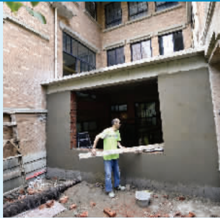
施工队正在凹槽空间加盖新房