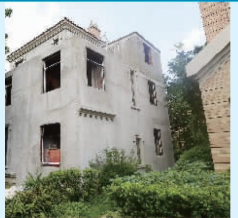
这栋楼被整体“增肥”了一圈