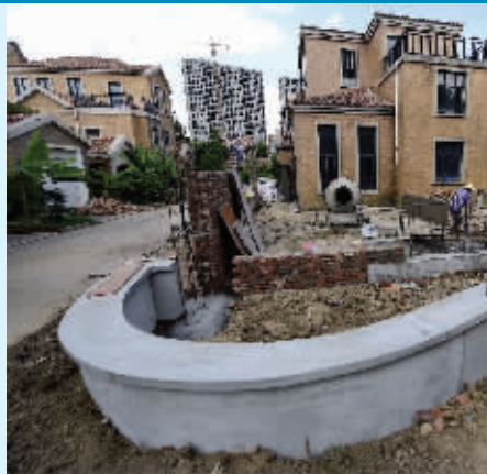
有的在庭院外重新建造低矮的围墙