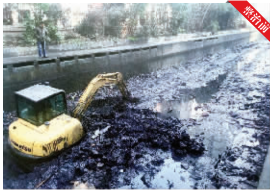
整治前的内秦淮河北支梅园新村段