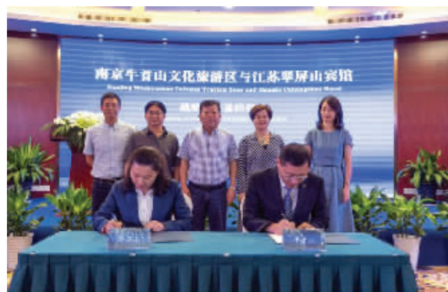
双方战略合作签约

近年来,牛首山文化旅游区按照“旅游+”多元融合的发展思路,与国内外相关产业的龙头型、旗舰型企业开展深度合作,引入了一批旅游度假、文化创意、体育休闲、教育慈善、健康养生等品牌项目,不断完善产品服务配套、扩大产业格局。在“旅游+”的发展思路下,牛首山文化旅游区将目光聚焦酒店产业。江苏翠屏山宾馆作为区域老牌四星级酒店,依山傍水、风景秀丽、交通便捷,具有稳定的中高端客源;牛首山文化旅游区开