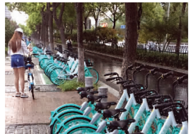
青桔单车昨天在建邺区投放