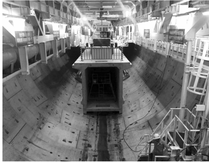
苏通GIL综合管廊工程穿越长江隧道贯通

淮南—南京—上海1000千伏交流特高压输变电工程是国家大气污染防治行动计划重点建设的12条输电通道之一,是华东特高压主网架的重要组成部分,工程于2014年4月21日获得国家发改委核准,同年7月全面开工建设,2016年工程五站四线建成投运。