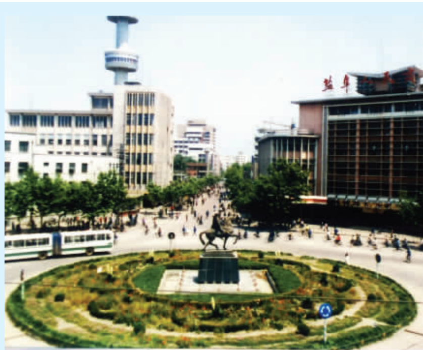
大铜马从1986年开始,就立在了盐城市区建军中路和解放中路的交叉口