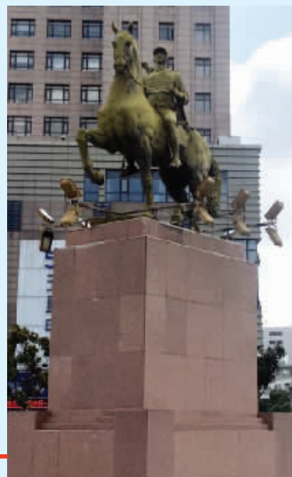
搬迁后的大铜马底座变高了一些