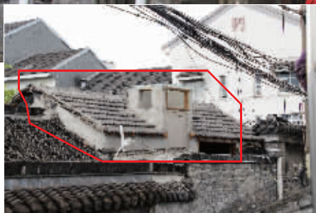
上：许氏盐商住宅外景 下：违建的阁楼(红线部分)和内部被烧得发黑的楼梯