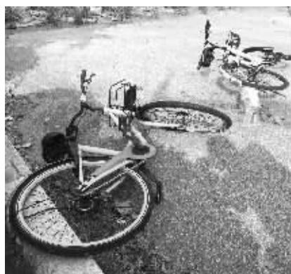
街头经常见到这样倒在地上的共享单车