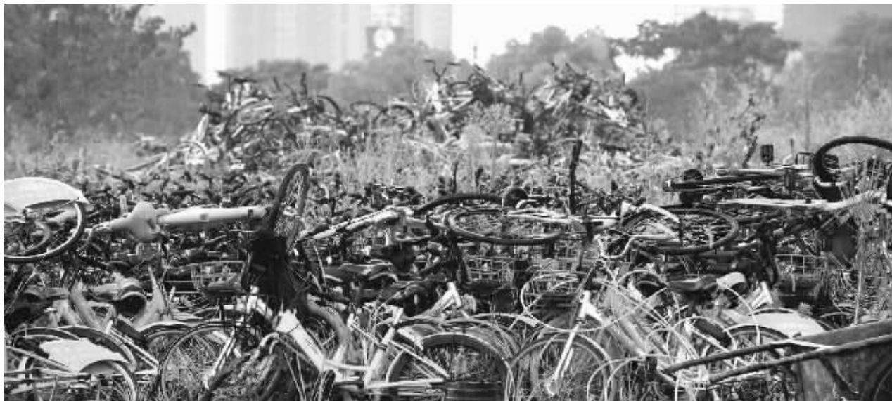
位于南京黄山路的一处共享单车扣车点,大量被清拖的单车杂乱堆放