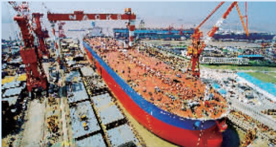
巨轮下水