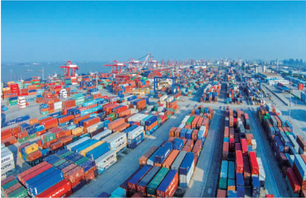
南通港口通天下

机构,集聚高层次人才领衔项目和高端创新资源。强化市、区部门联动,与中创区联合引进3-5家院所研发机构,引领大院大所联动发展,为构建完善的区域创新体系注入新活力。 2017年,崇川全区完成地区生产总值772.23亿元,是三年前的1.23倍,服务业增加值、社消零总额、进出口总额等指标连续三年蝉联全市第一。近期,江苏全省十三市中心城区主要经济指标中,崇川的11项主要经济指标位列前三名。其中一般公共预算收入GDP占比、出口总额、高新技术产业产值占比、专利申请量4项指标全省第一。 亮眼的成绩单,让崇川更为之计深远。今年5月,崇川区委书记吴旭在讲话中提出,全区要制定追赶超越计划,以进入全市前列为基本追求,勇当全市、全省高质量发展排头兵。到2020年,崇川将力争GDP突破1000亿元,一般公共预算收入100亿元,实现地均GDP10亿元/平方公里,增长29.5%。