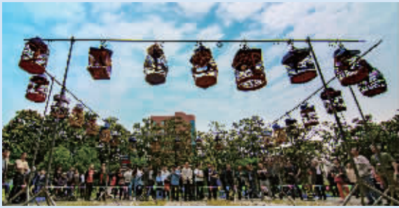
雀鸟大舞台