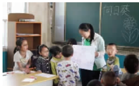
支教活动时的照片