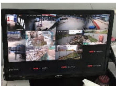
实时监控工地现场(碧桂园·凤凰城)

碧桂园江苏区域在承接集团对工程质量的要求和标准下,结合区域实际,根据施工过程中的结构阶段、砌体阶段和抹灰阶段,形成了具有江苏区域特色的十二项标准工艺,保证了施工过程的标准化和高效率。