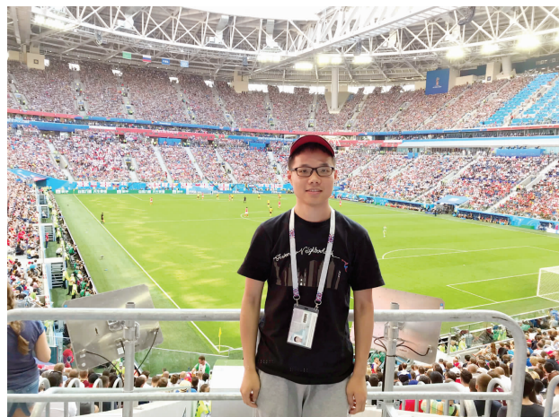
采访俄罗斯世界杯的经历让快报记者终身难忘

36天、五座城市、60余篇稿件,这是属于我的世界杯记忆。决赛过后,世界杯已经结束,我也将背上行囊回国。36天的记忆,就像放电影般在脑海里一一掠过。6月11日落地莫斯科谢列梅捷沃机场的情景,仿佛昨天一般,而今天,我即将踏上回国的飞机。