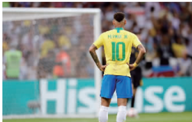
期待内马尔领衔的巴西4年后卷土重来

巴西队长米兰达在被淘汰后说,相信年轻的优秀球员能够为巴西再次赢得世界杯,但这又会是会在何时? 蓬蓬