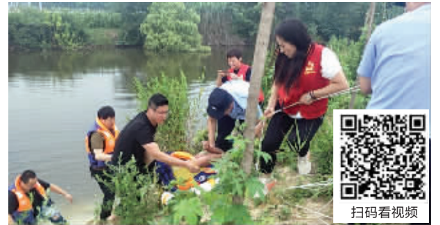
轻生女子被救上岸

快报讯(记者 孙旭晖)最近,宿迁市湖滨新区发生惊险一幕:一名女子轻生跳入一处沙塘,由于轻生意志比较坚决,即使整个人都陷入沙塘里仍拒绝救援,这给救援工作平添了许多困扰。最后,女子被强行救了上来,但把两位民警和5名救援志愿者都累趴了。