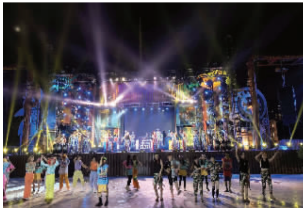
恐龙园新区域——疯狂恐人