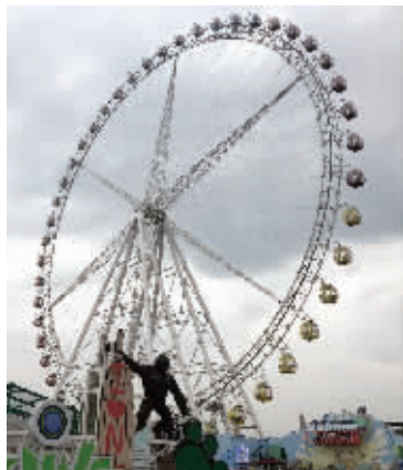
环球港“世界港口小镇”

上周末,2018“激情之夏”常州旅游节正式拉开帷幕。记者了解到,今年夏天常州不仅有水世界、夜公园等传统经典旅游产品,还有不少新产品面世,如恐龙园全新区域——“疯狂恐人”、江南环球港——“世界港口小镇”屋顶游乐场、金坛茅山宝盛园的全新亮相,都将成为常州旅游界的产品“新秀”,为广大市民游客夏日出游提供更多选择和乐趣。