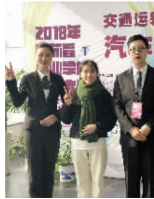
技能竞赛获奖师生