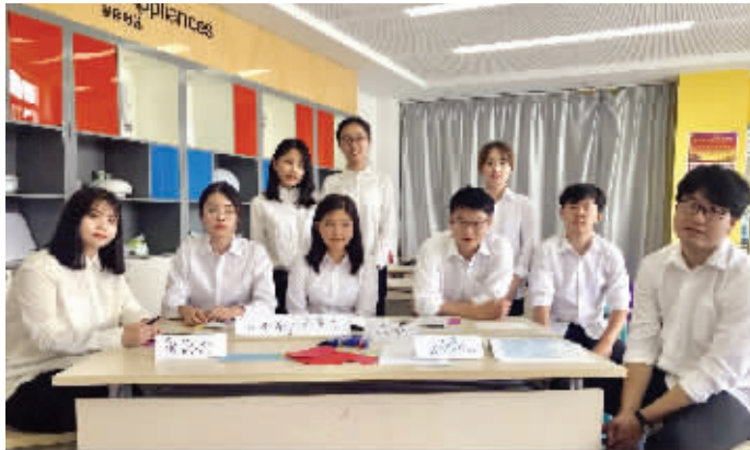
直通大学的9名学生